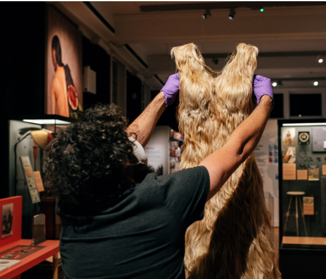
Installation of Hair Dress by artist Jenni Dutton in Hair: Untold Stories, Horniman Museum and Gardens.