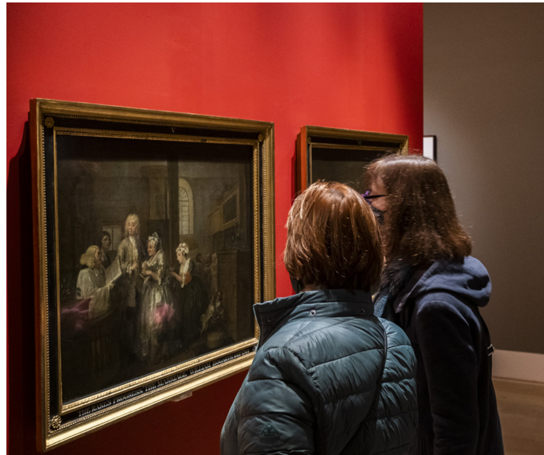
Pitzhanger Manor & Gallery, London, December 2020 taken during COVID-19 face-mask restriction

I gael rhagor o wybodaeth, neu i drafod unrhyw syniadau neu'r broses ymgeisio, cysylltwch â Gracie Divall, Rheolwr Prosiect Going Places: gdivall@artfund.org