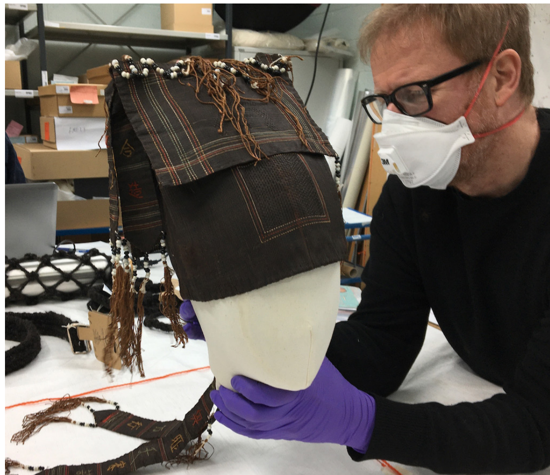
Horniman staff checking Asian Yao Priests hat made from hair, part of the exhibition Hair: Untold Stories, 2021.